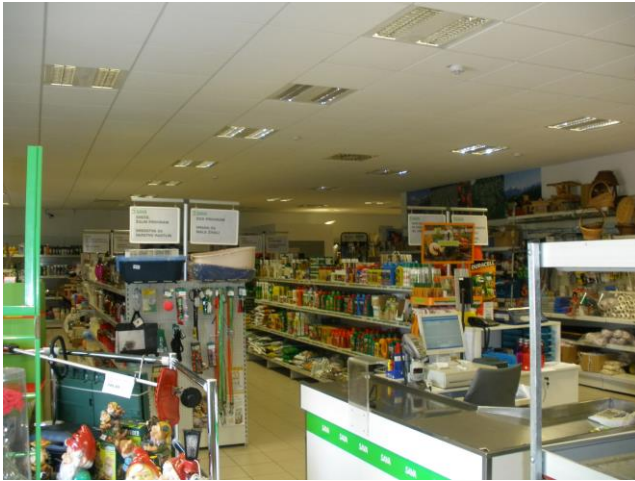
Slika 5: Ostali prodajni program

Trgovina je celo leto odprta od ponedeljka do petka od 8.-19. ure in v soboto ob 8.-12. ure, v njej pa Vam nudimo: