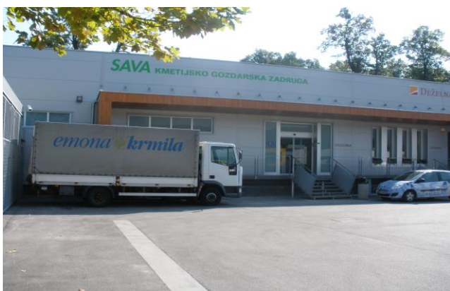
Slika 3: Trgovina

Začetki trgovine segajo v čas pred letom 1960, ko so ob takratnem sedežu Uprave zadruga v Radovljici odprli trgovino s kmetijskim repromaterialom. Leta 1971 ji je sledilo odprtje živilske trgovine s poudarkom na prodaji kmetijskih pridelkov in izdelkov (prodajali so kruh manjše lokalne pekarnice, domače sveže in kislo zelje, kumarice, paradižnik, skuto, jajca, krompir...) . Pozimi leta 1983 so se Uprava in trgovini preselili na zdajšnjo lokacijo v Lesce. Tam je trgovina dobila svoje prodajne prostore poleg poslovnih prostorov, ter kletni prostor za namen skladiščenja kmetijskega repromateriala. Do danes je trgovina v Lescah doživela še dve prenovi, in sicer leta 2000 z manjšo adaptacijo, ter leta 2008 s celovito prenovo. Leta 1991 smo, vendar le za kratek čas, odprli še trgovino s kmetijsko-tehničnim blagom v Kranjski Gori.