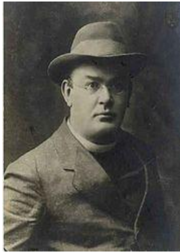
Slika 1: Janez Evangelist Krek

Po Zakonu o gospodarskih zadrugah iz leta 1973 iz obdobja kraljevine Jugoslavije, je zadrugo lahko ustanovila skupina z najmanj 10 osebami. Cilji združništva so bili pospeševanje določenih dejavnosti in poslov po načelu vzajemne pomoči članov zadruge. Dobiček zadruge se je delil med člani zadruge. Poleg pašniških, lesnih, vinarskih, mlekarsko-sirarskih zadrug so se začele ustanavljati tudi finančne zadruge, kot so hranilnice in posojilnice. Zadruge so se vpisovale v sodni in gospodarski register. Kontrolo poslovanja zadrug so opravljale revizijske zveze.