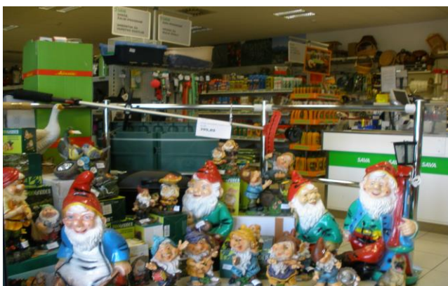
Slika 4: Ljubiteljski prodajni program

Današnja trgovina Lesce se nahaja v prostorih upravne stavbe v Lescah, nasproti Mercator centra in oskrbuje kmete s kmetijskim repromaterialom, ter obenem skrbi, da zadovolji potrebam kupcev, ki se s kmetijstvom ukvarjajo zgolj ljubiteljsko.